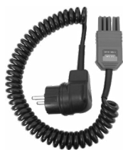
Adapter WS-05 (wtyk kątowy UNI-Schuko)