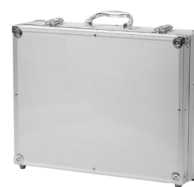
Walizka alumi- niowa na mierniki i wyposażenie