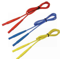
Przewód 1,2 m (wtyki bananowe) czerwony / nie- bieski / żółty