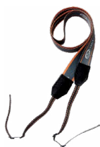
Szelki do mier- nika (typ M1)