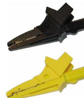
Krokodylek 1 kV 20 A czarny / żółty